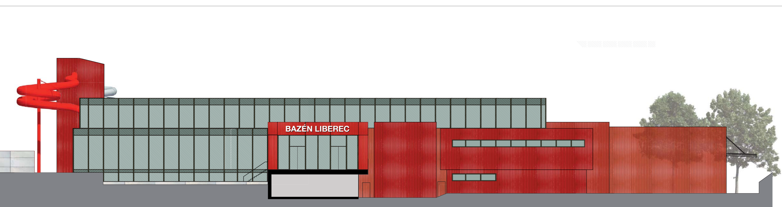
Pohled Z - m 1:250