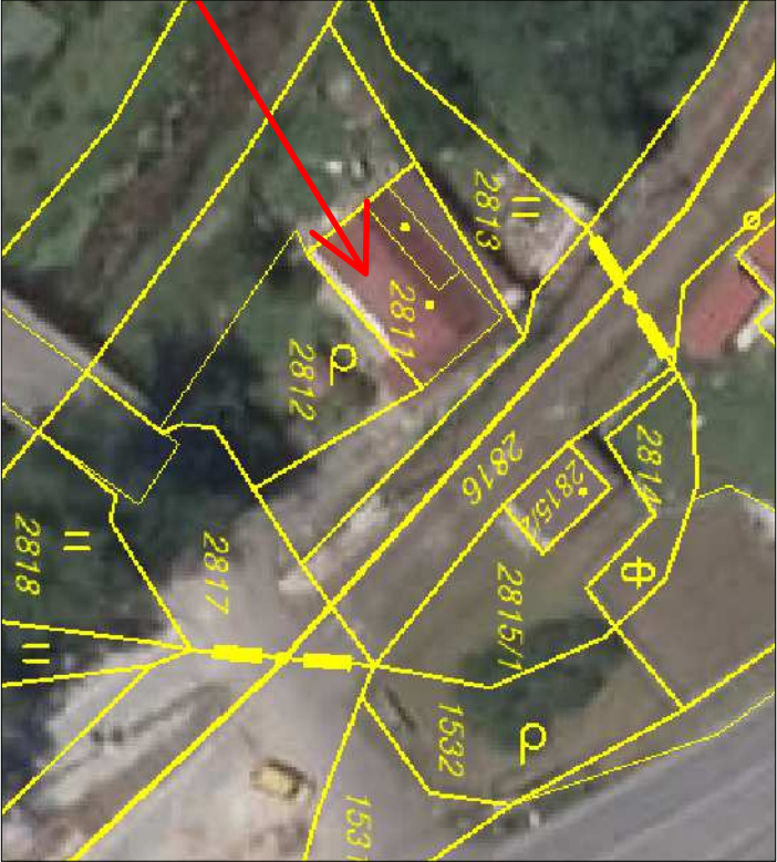
Demolovaný objekt (rodinný dům, zahrada)