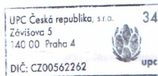
Jaroslav Růžička Oddělení dokumentace

Vyjádření vydala společnost UPC dne: 6.1.2017