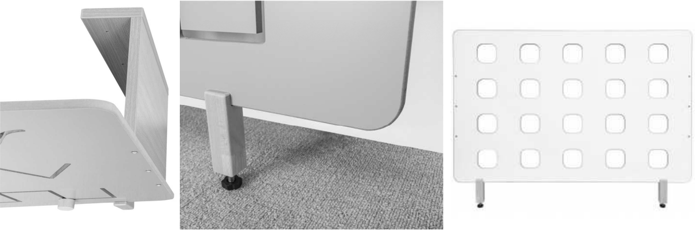
POŽADOVANÝ VZHLED KRYTU - MOŽNÉ VARIANTY VÝŘEZU

POZN. VÝŠKOVĚ OSADIT DLE POZIC RADIÁTORŮ OVĚŘIT HLOUBKU RADIÁTORU (PŘEDPOKLÁDÁNO 150MM) CENTROVAT NA POZICI RADIÁTORU VÝŠKA RADIÁTORU JE 600MM