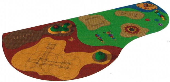
TYP HERNÍHO POVRCHU

UMĚLÝ POLYURETANOVÝ POVRCH EPDM + SBR DVOUVRSTVÝ