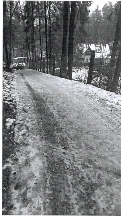
Lesní cesta – úsek se žlabem