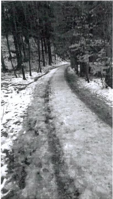
Lesní cesta – rekonstruovaný úsek