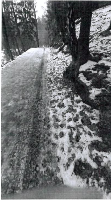
Lesní cesta – vpravo bude umístěn žlab