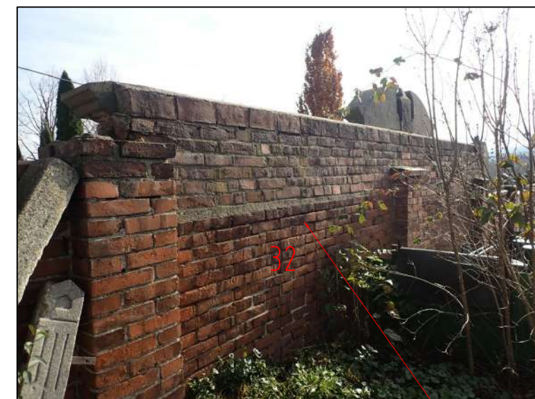
HROBKA 32 - RUVOVÁ STRANA