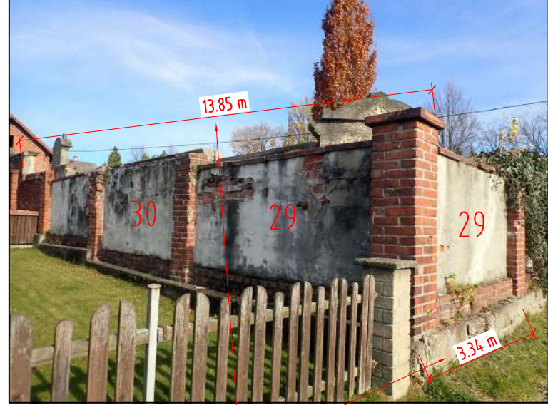
HROBKA 29 VNĚJŠÍ STRANA

POKUD TO BUDE TECHNICKY MOŽNÉ, BUDE PROVEDENA NOVÁ HZ, VĚTNÉ ZÁKLADY A ROHOVÝH SLOUPKŮ, POKLEDY PLOCHY ZD BUDOU ZDĚNÉ - BEZ OHNĚTKY