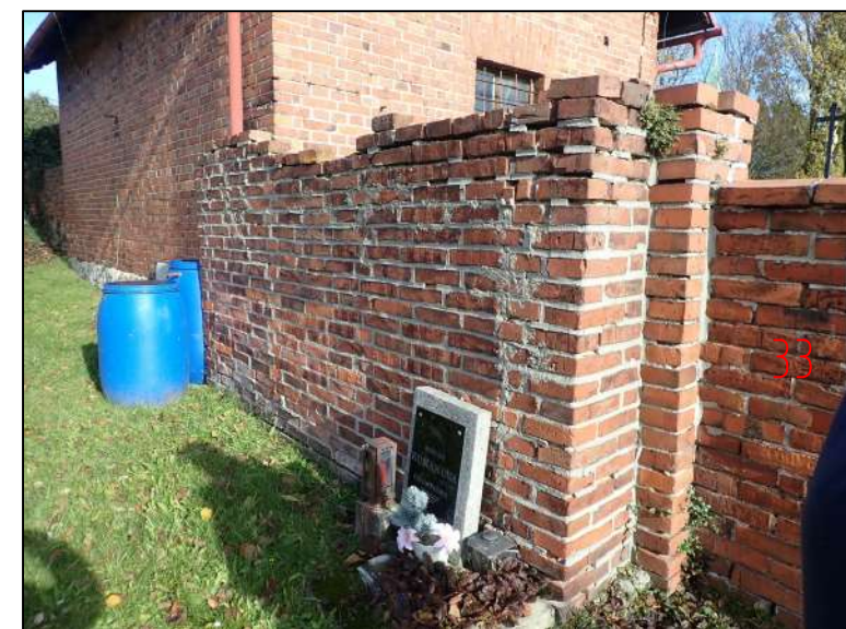
RUB HZ U MÁRNICE - OD HŘBITOVA VLEVO