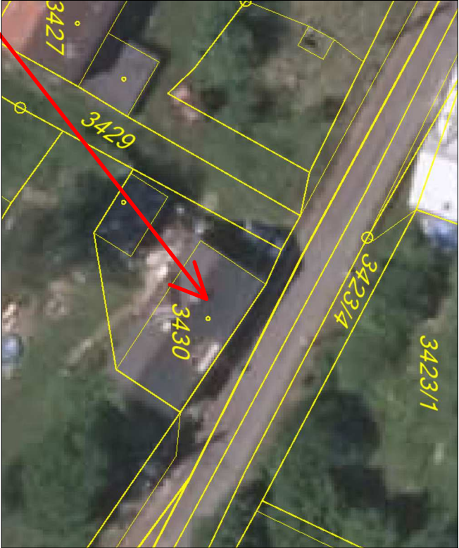
Demolovaný objekt (rodinný dům)