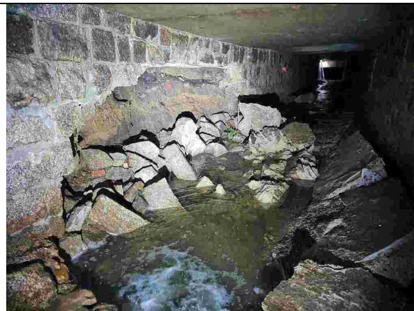
Celkový pohled na poškozenou nátrž