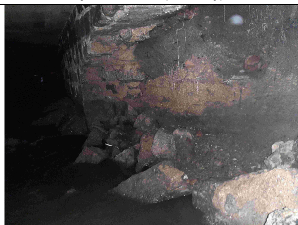
Detailní pohled na poškozenou nátrž a dno potoka