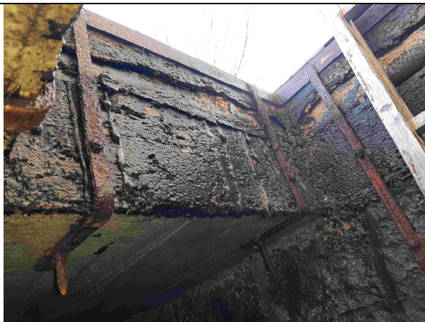
Pohled stávajícím vlezem do zakrytého profilu potoka tl. stropu 350 mm