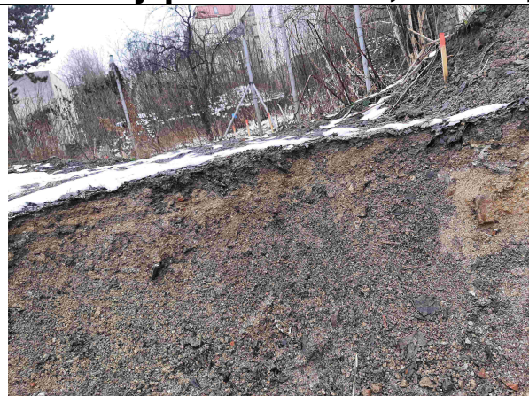
Pohled na vytyčenou nátrž levobřežní zdi na úrovni stávajícího terénu (navážky)